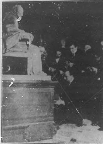
Momento en que el Ministro de Instrucción Pública, restituyó el estuche que contiene el corazón de Voltaire al zócalo de la estatua de éste en la Biblioteca Nacional de París.

el Aula Magna, con asistencia de un nutrido núcleo de intelectuales. Hubo discursos y lectura de temas escogidos. La presencia del señor Secretario de Estado, y la audición, por una banda militar, del