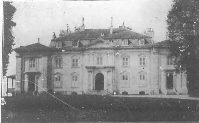
El castillo de Voltaire, en Ferney.

Hace pocos días, el 30 de Abril celebró la Facultad de Letras y Ciencias de la Universidad el 300 aniversario del nacimiento de William Shakspeare. El acto se efectuó con toda pompa, en