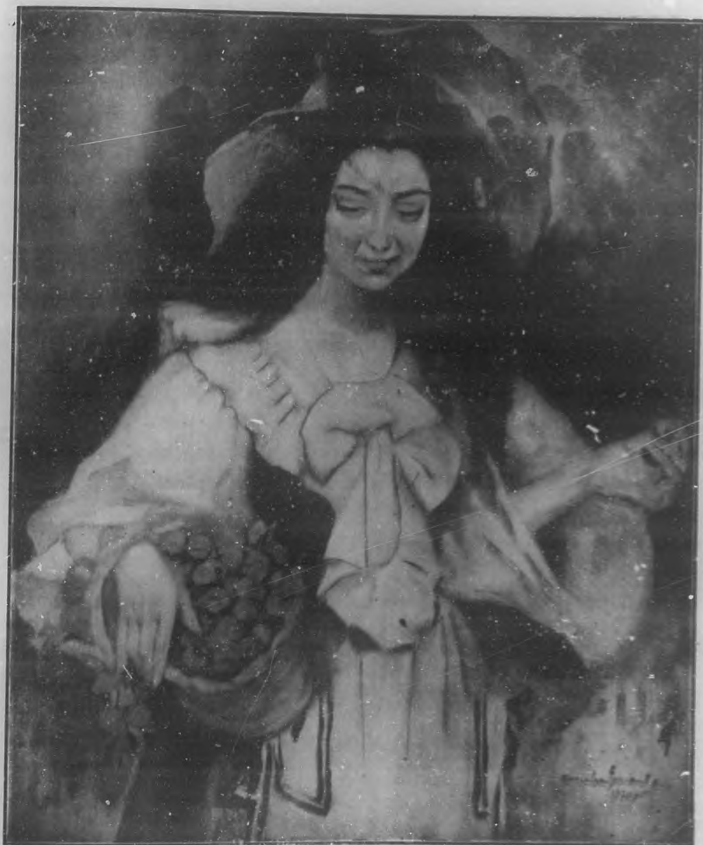
CEREZAS Oleo de Concha Ferrant B. S.