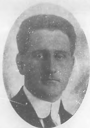
RUBÉN DÍAZ IRIZAR Joven y reputado arquitecto, a quien se deben muchas obras que han contribuido al mayor ornato de la ciudad por sus bellezas arquitectónicas.