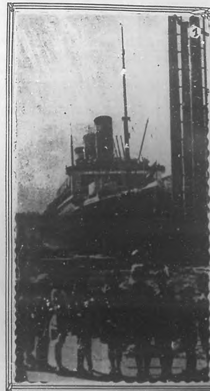
1.-El "Leviathan" en Brooklyn. 2.-El viaje de prueba del "Leviathan". 3.-Los dos mas grandes buques de los Estados Unidos.—El "Leviathan" mercante y el "West Virginia" acorazado de guerra.