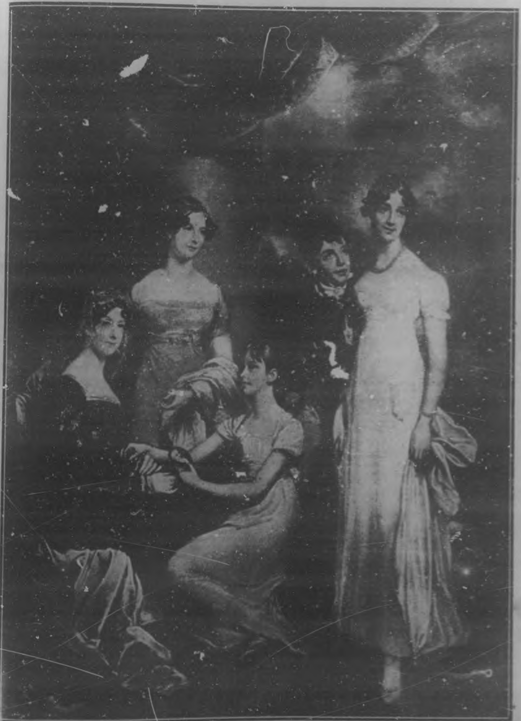
LA MUJER QUE BYRON AMÓ FERVOROSAMENTE Con motivo del centenario de la muerte de Lord Byron, se ha publicado en Inglaterra el cuadro que arriba reproducimos, en el que junto a su madre y hermanos, aparece—en la extrema derecha—Lady Frances Wedderburn, bella dama inglesa que Byron amó fervorosamente.

Se publica todos los viernes con excepción, naturalmente, de los días feriados. Se vende en todas las librerías nacionales y extranjeras. Cable: "Bohemia". Telégrafo: Bohemia. Año: 1916 Redacción, Administración y Talleres: Edificio de BOHEMIA, Avenida Arca (antes Teófilo de los Andes) No. 21 y 23. Teléfono: 1100. M-3321; Administración, A-918.