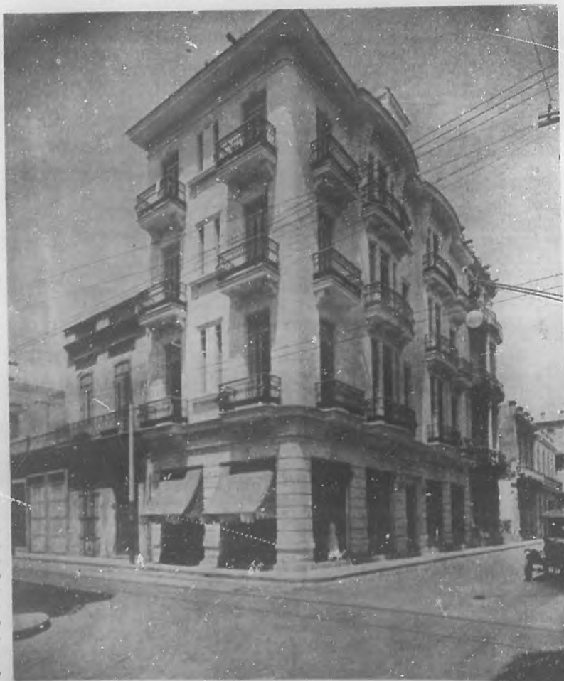
NUESTROS PROGRESOS URBANOS. —Hermoso edificio situado en la calle de Consulado esquina a Refugio y que ha sido construido según los planos y bajo la experta dirección del reputado arquitecto señor Rubén Díaz Irizar.