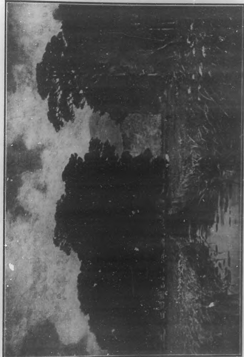
(Grabado tricolor de BOHEMIA)