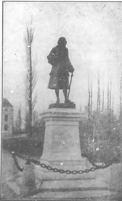
Estatua de Voltaire, erigida en Ferney, población de los alrededores de Ginebra.